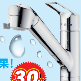
※画像はイメージです。