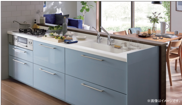
※画像はイメージです。

キッチン 家事がラクになるキッチン TOTO SYSTEM KITCHEN mitte ミッテ 2550サイズ I型 希望小売価格 800,690円(税込) 320,000円 60% OFF! 食器洗い乾燥機なし (税込・工事費別途) 標準プラン